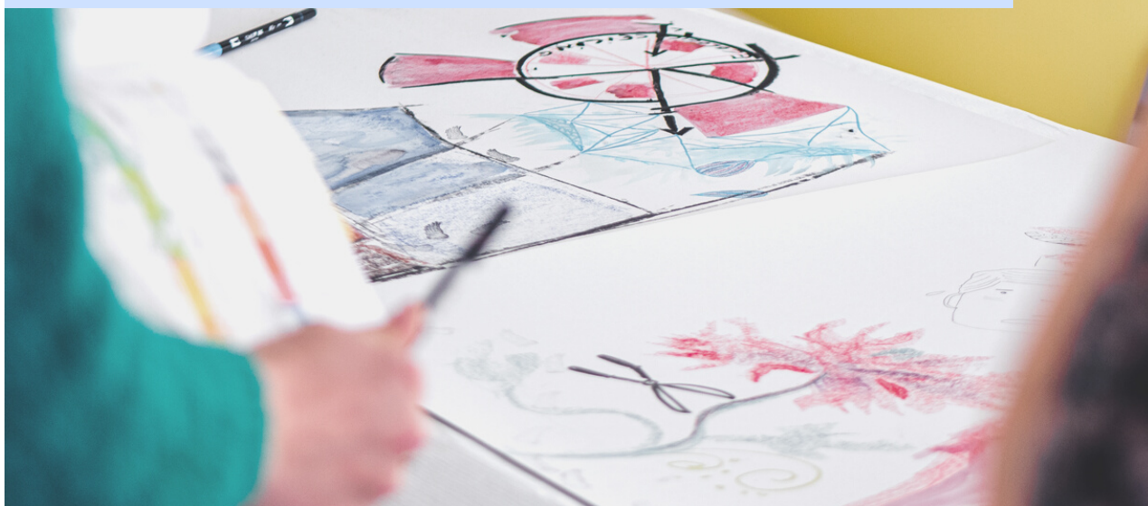
Fresque collective réalisée dans le cadre de la Semaine de la Durabilité 2023